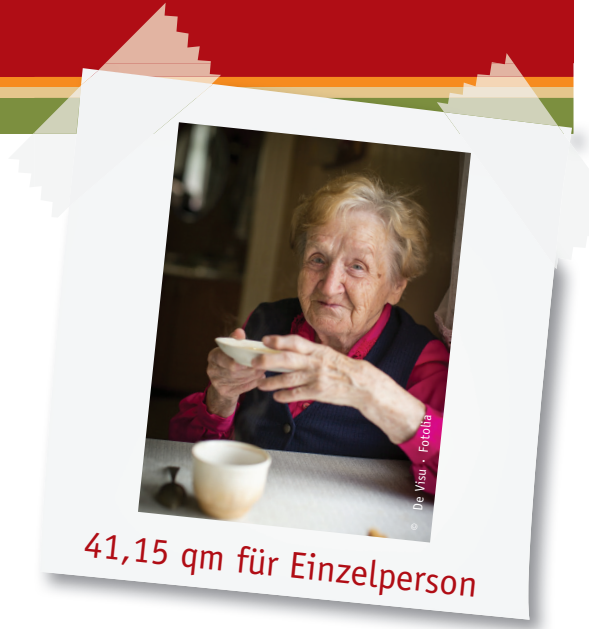
41,15 qm für Einzelperson